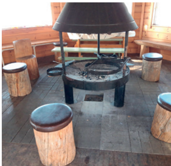
Latupirtin kivi on ympäri vuoden avoin retkeilijöille. Pidetään yhdessä kiviä siistinä.