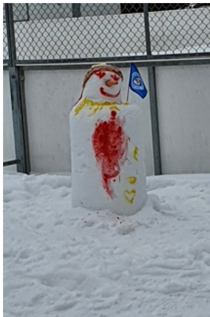
Nähdään taas ensi talvena!