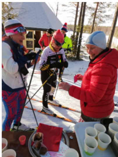
Savoniahihdon huoltopiste toimii!