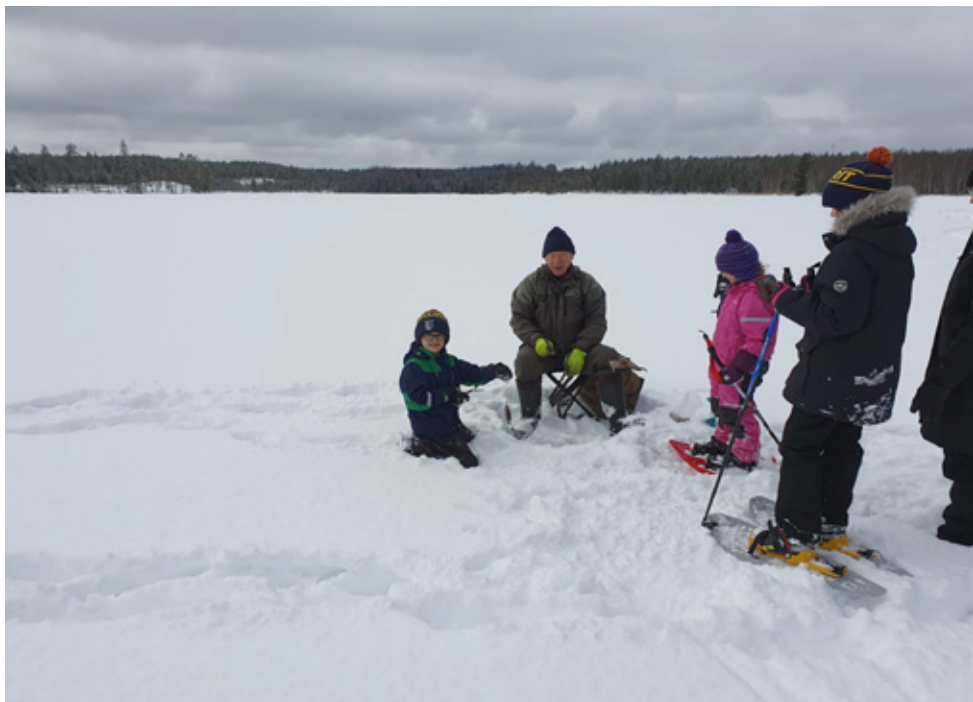
Pilkillä ahvenia narraamassa.