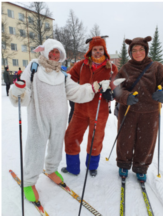
"Metsän eläimetkin" viihtyivät Urskissa.