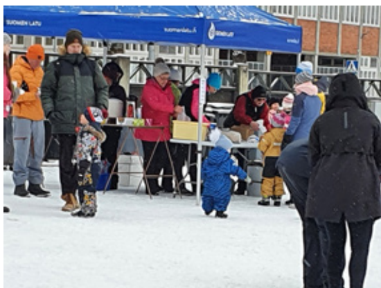
Urskin perhetapahtuman osallistujia ja talkoolaisia.