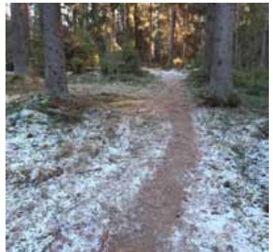
Soihtukävely (hiihto) talvella 2020.