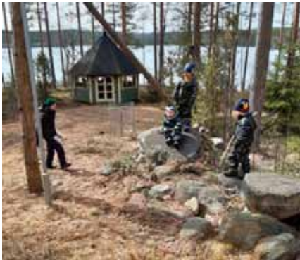
Lasten iloja Pirtillä.