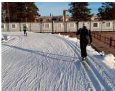
Ensilumen latu, kuin myös koko talven latu.