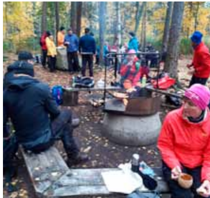
Retkeläiset tauolla Repovedellä.