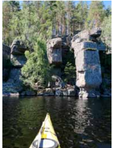
Kuva Puulalta; Irma Makkonen

Tuolloin Suomi Meloo järjestää ensimmäisen Erämelonta-Jotoksen Mäntyharjulla ikäänkuin korvaamaan kesäkuun alussa peruuntunutta perinteistä Suomi Meloo -ta- pahtumaa. Käy tutustumassa erämelonta.fi -sivustolla aiheeseen. Meidän melonnan yhdyshenkilömme Antti Toivanen kertoo myös mielellään tapahatumasta osoitteessa antti.m.toivanen@gmail.com tai puh.040 823 0621.